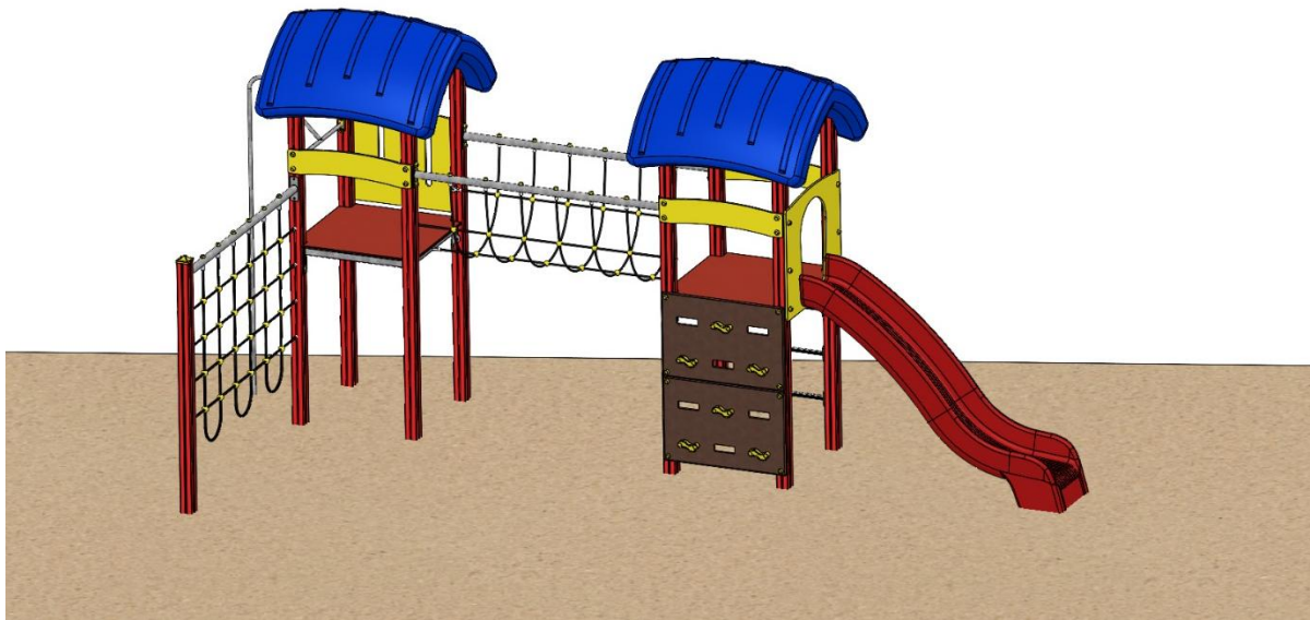
Abbildung ist beispielhaft und kann in der Farbe vom Original abweichen