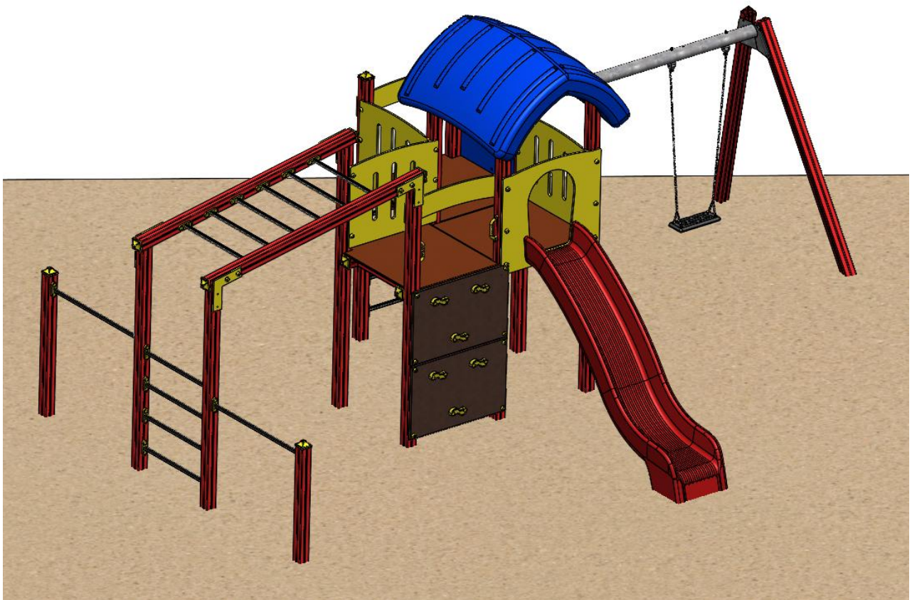
Abbildung ist beispielhaft und kann in der Farbe vom Original abweichen