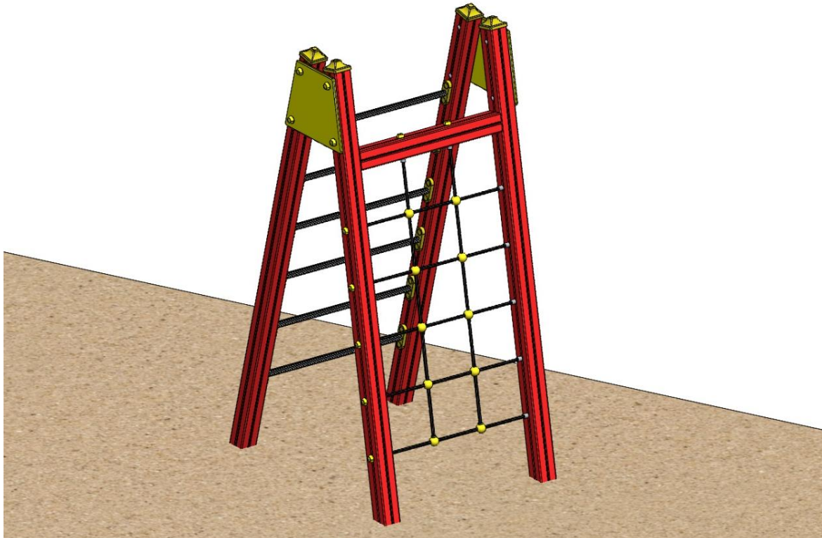
Abbildung ist beispielhaft und kann in der Farbe vom Original abweichen