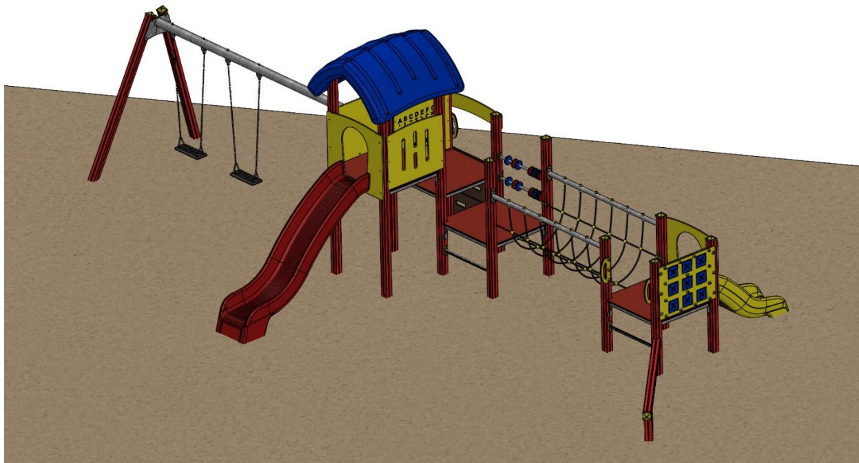
Abbildung ist beispielhaft und kann in der Farbe vom Original abweichen