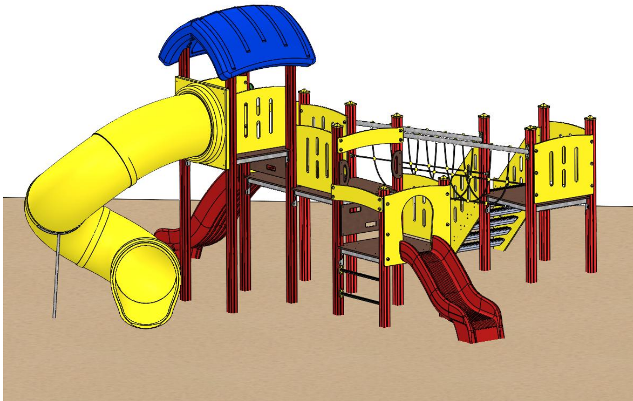
Abbildung ist beispielhaft und kann in der Farbe vom Original abweichen