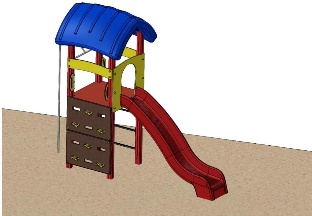
Abbildung ist beispielhaft und kann in der Farbe vom Original abweichen