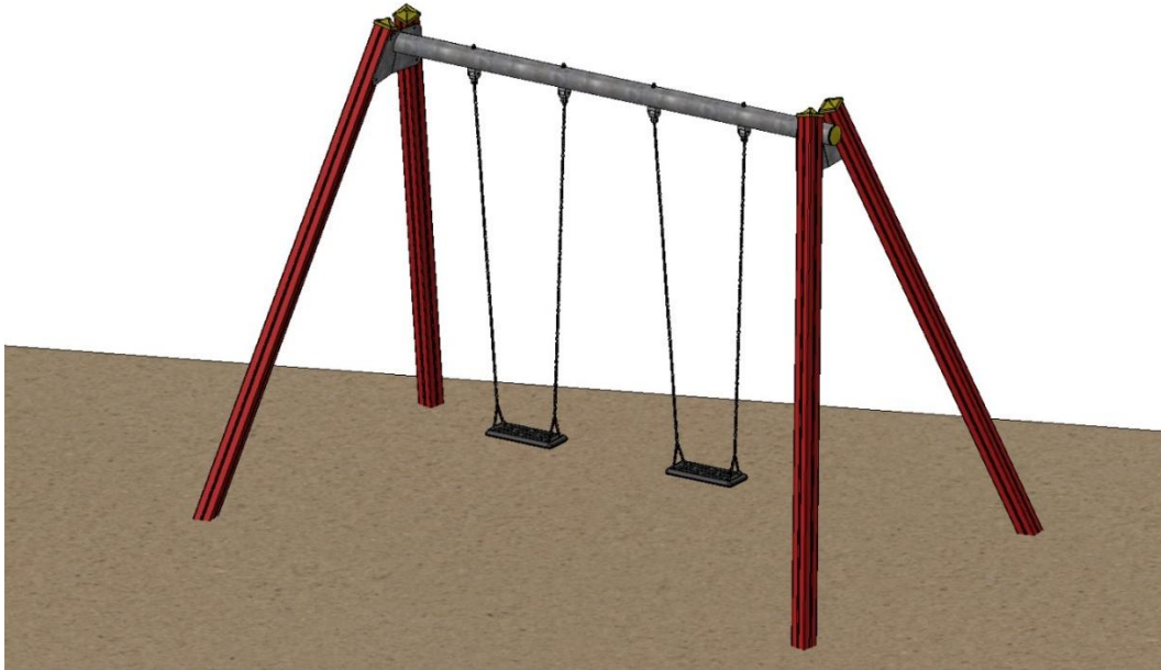
Abbildung ist beispielhaft und kann in der Farbe vom Original abweichen.

Bezeichnung: espas Premium Doppelschaukel 2,5m